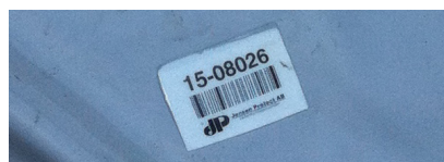
Viivakoodi on eristepeitteen joka kulmassa.

Eristepeite on tehty PVC-kankaasta, laatu JP 703. Eristemateriaali on 10 mm paksu polyeteenisolumuovi.