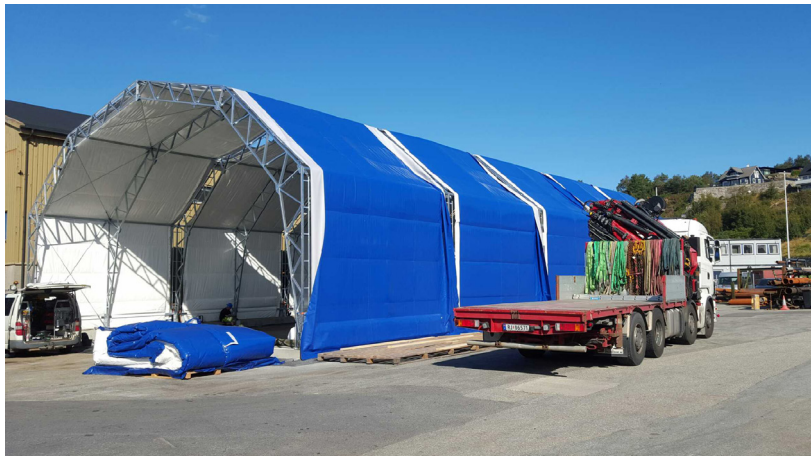
JP ISOhalleja on saatavilla kaikkina kokoina ja malleina.

JP ISOhallit pitävät kylmällä lämmön ja kuumalla viileyden sisällä. Ne tarjoavat erinomaisen ratkaisun halleissa työskenteleville tai niissä säilytettävälle herkille tuotteille.