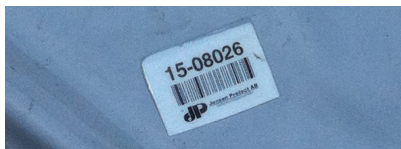
Strekkoden finns i alla fyra hörn av er isolermatta.

Isolermattan består av PVC-duk av kvalitet JP 703 och isoleringsmaterialet är 10 mm tjock polyetencellplast. Öljetter och bindrep.